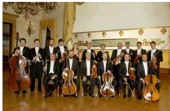
I Solisti Veneti

10. Beyoncé si schiera in difesa dei gay