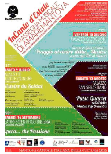
La locandina dell'evento. Sotto l'edizione dell'anno scorso