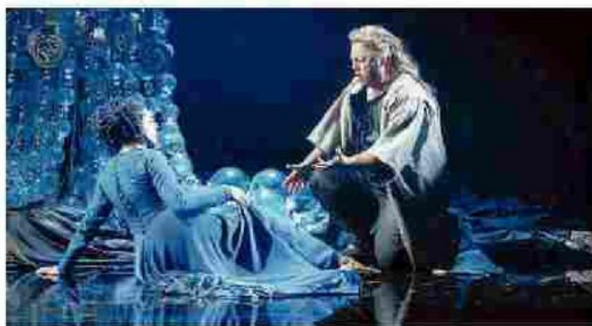
Il mezzosoprano Barcellona con il tenore Gregory Kunde